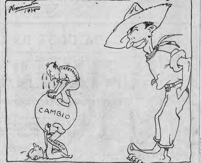
Des millones de aumento en aduana representa varios millones de aumento en la importación, y como la exportación no ha aumentado, quiere decir que el comercio se ha indigestado. Eso es todo!

Las entradas de aduana aumentaron en dos millones en 1934.